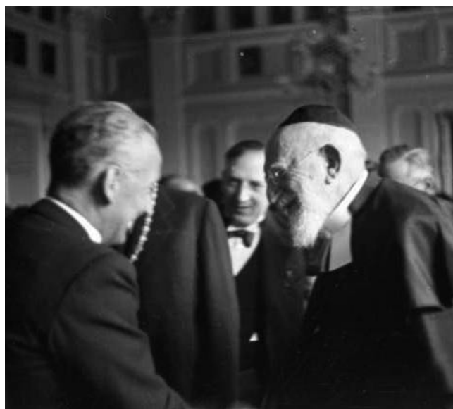
Szent-Györgyi Albert és Löw Immanuel, 1938

Kecskeméti Ármin makói főrabbi 1944 januárjában többek között az alábbi szavakkal köszöntötte Löw Immanuel 90. születésnapja alkalmából a régi zsinagógában: